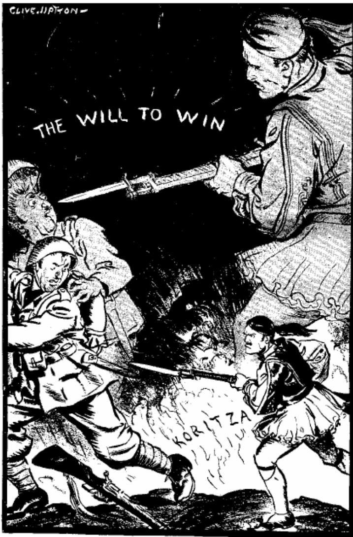
THE QUALITY OF MAN

By courtesy of the "Daily Sketch" ... the Artist, Clive Upton.